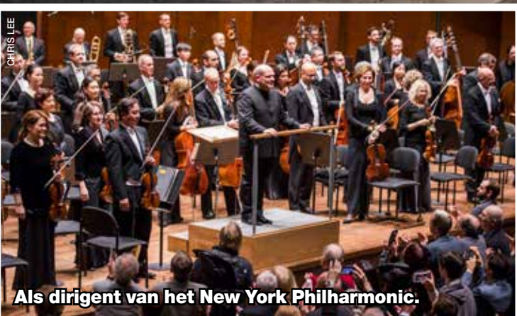
Als dirigent van het New York Philharmonic.